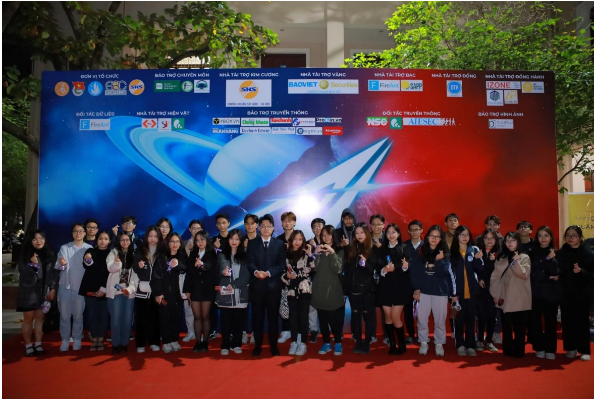
SHS – NHÀ TÀI TRỢ KIM CƯƠNG