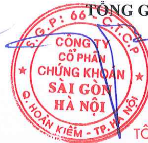
Ngô Thế Hiền