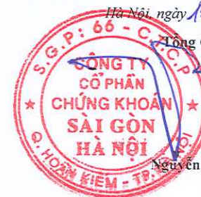
Nguyễn Chí Thành