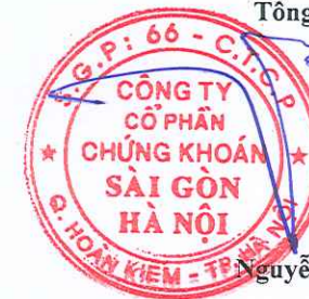
Nguyễn Chí Thành